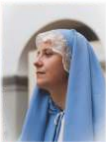
Lucija Ojsteršek Marija Jezusova mati